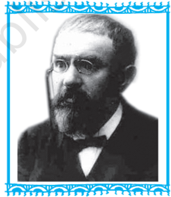
Henri Poincaré (1854-1912)

अवकल समीकरणों का उपयोग मुख्य रूप से भौतिकी, रसायन विज्ञान, जीव विज्ञान, मानव विज्ञान, भूविज्ञान, अर्थशास्त्र आदि विभिन्न क्षेत्रों में किया जाता है। अतः सभी अत्याधुनिक वैज्ञानिक अन्वेषणों के लिए अवकल समीकरणों के गहन अध्ययन की अत्यंत आवश्यकता है। इस अध्याय में, हम अवकल समीकरण की कुछ आधारभूत संकल्पनाओं, अवकल समीकरण के व्यापक एवं विशिष्ट हल, अवकल समीकरण का निर्माण, प्रथम कोटि एवं प्रथम घात के अवकल समीकरण को हल करने की कुछ विधियाँ और विभिन्न क्षेत्रों में अवकल समीकरणों के कुछ उपयोगों के बारे में अध्ययन करेंगे।